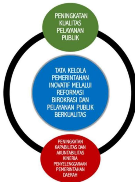
Kerangka Logis Perencanaan Terintegrasi Misi 4