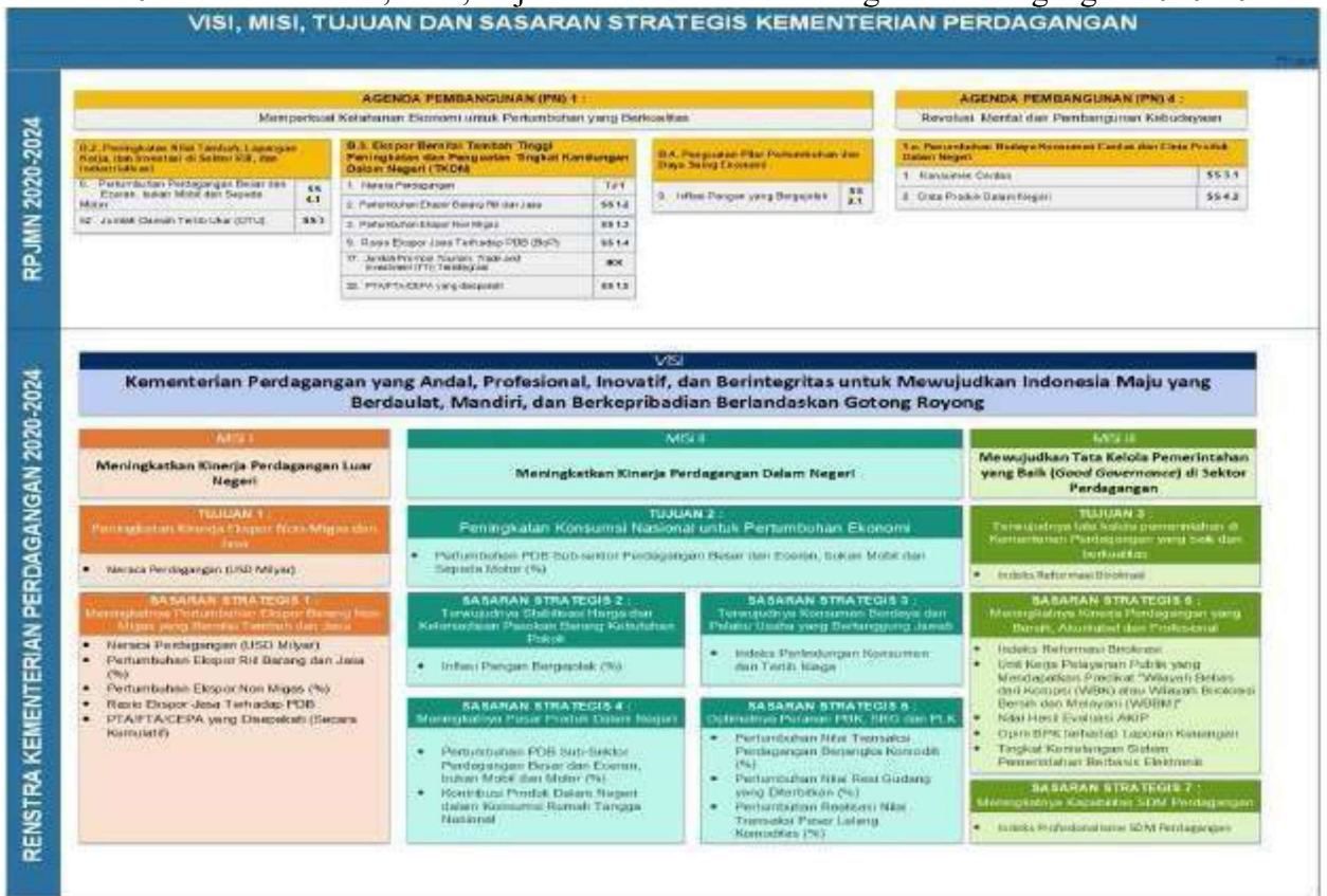
Gambar 10 Keterkaitan Visi, Misi, Tujuan dan Sasaran Pembangunan Perdagangan 2020-2024

Adapun keterkaitan antara visi, misi, tujuan, dan sasaran yang ingin dicapai pada masing-masing tujuan yang telah dipaparkan di atas, secara umum dapat dilihat pada diagram berikut ini. Sebagai catatan, dalam Renstra ini terdapat penyesuaian target kinerja khususnya pada tahun 2020 sebagai respon dari eskalasi pandemi Covid-19 terhadap perekonomian nasional yang pada gilirannya berkonsekuensi pada penghematan APBN Tahun Anggaran 2020, termasuk pada anggaran Kementerian Perdagangan.