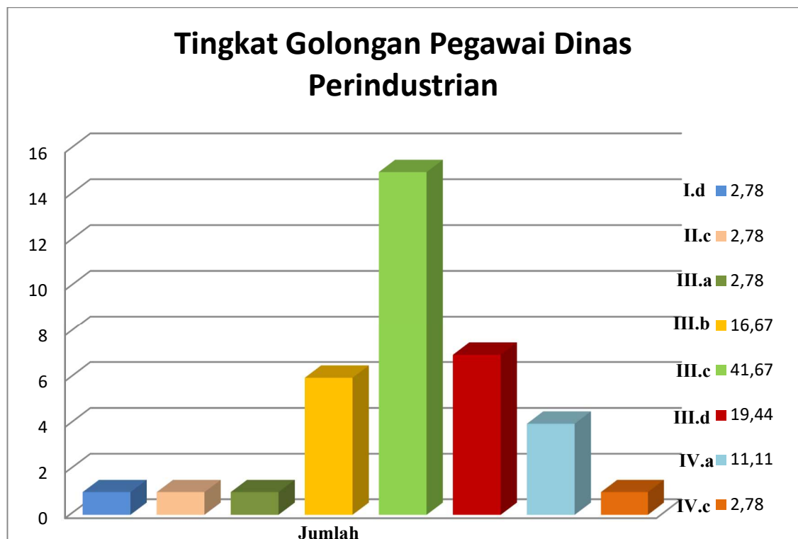
Gambar 2.2. Diagram Tingkat Pangkat dan Golongan pegawai Dinas Perdagangan dan Perindustrian Kabupaten Gowa