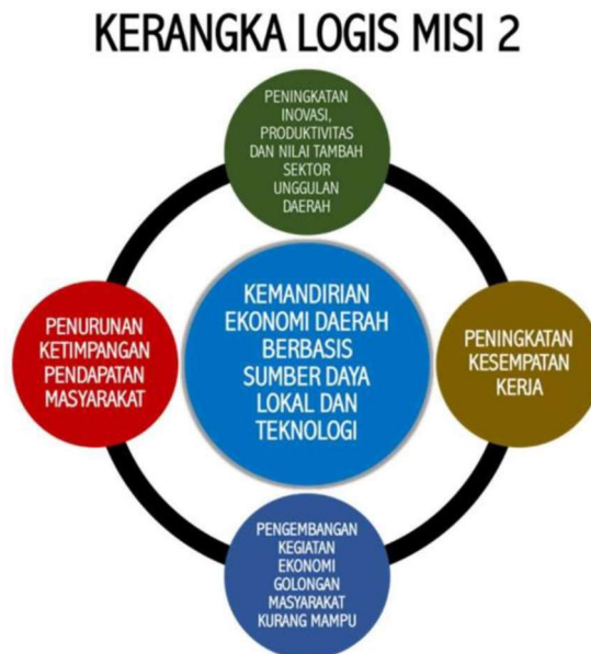
Kerangka Logis Perencanaan Terintegrasi Misi 2

meningkatkan pemberdayaan ekonomi kerakyatan. Dalam upaya pencapaian Misi 2 maka dirumuskan Perencanaan Terintegrasi dalam Langkah Pencapaian Misi 2 sebagai berikut :