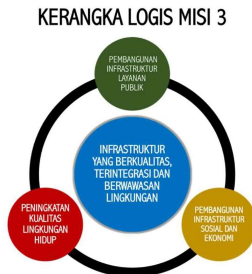
Kerangka Logis Perencanaan Terintegrasi Misi 3

Meningkatkan infrastruktur yang berkualitas, terintegrasi dan berwawasan lingkungan merupakan upaya umum Pemerintah Kabupaten Gowa dalam meningkatkan aksesibilitas dan kualitas infrastruktur dasar, pemanfaatan dan pengendalian penataan ruang serta kualitas perumahan dan kawasan permukiman. Dalam upaya pencapaian Misi 3 maka dirumuskan Perencanaan Terintegrasi dalam Langkah Pencapaian Misi 3 sebagai berikut :